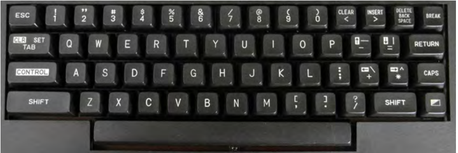
Abb. 2.23: Normaltastatur der XL-Modelle